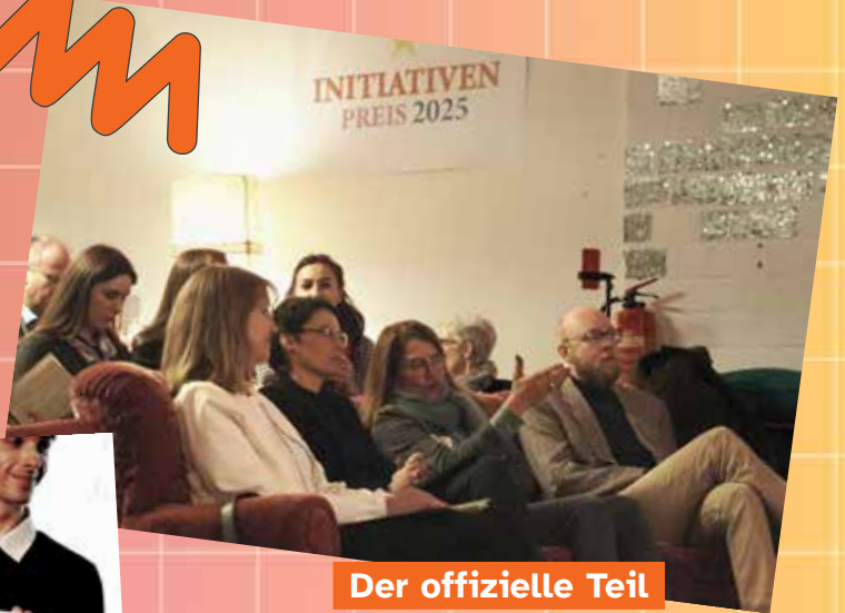
Der offizielle Teil