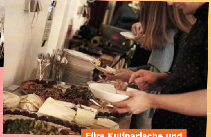
Fürs Kulinarische und gemütliche Beisammensein war gesorgt.