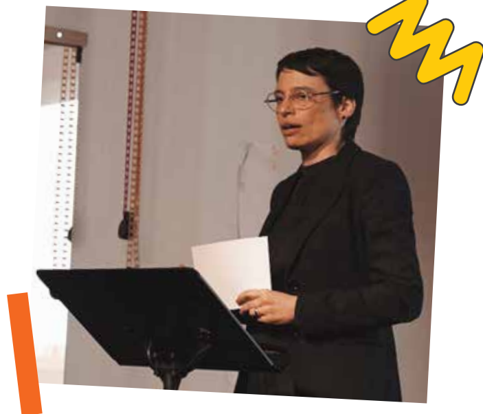
Josefine Paul, Ministerium für Kinder, Jugend, Familie, Gleichstellung, Flucht und Integration NRW

Im vergangenen Jahr wurde ich in einem Interview gefragt, welches Wort ich in ein Wörterbuch aufnehmen würde, wenn ich es könnte, und was seine Bedeutung wäre. Ich habe geantwortet: „Ambiguitätstoleranz“: Unsere Welt ist komplex und voller Widersprüche, die trotzdem für sich genommen Sinn machen können.