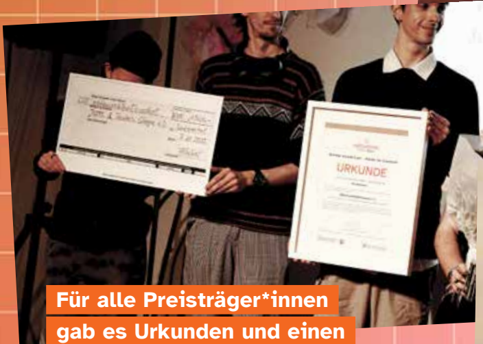
Für alle Preisträger*innen gab es Urkunden und einen Scheck über das Preisgeld